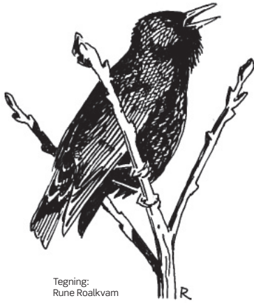
Tegning: Rune Roalkvam